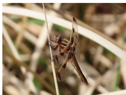
↑羽化して数日の未成熟メス