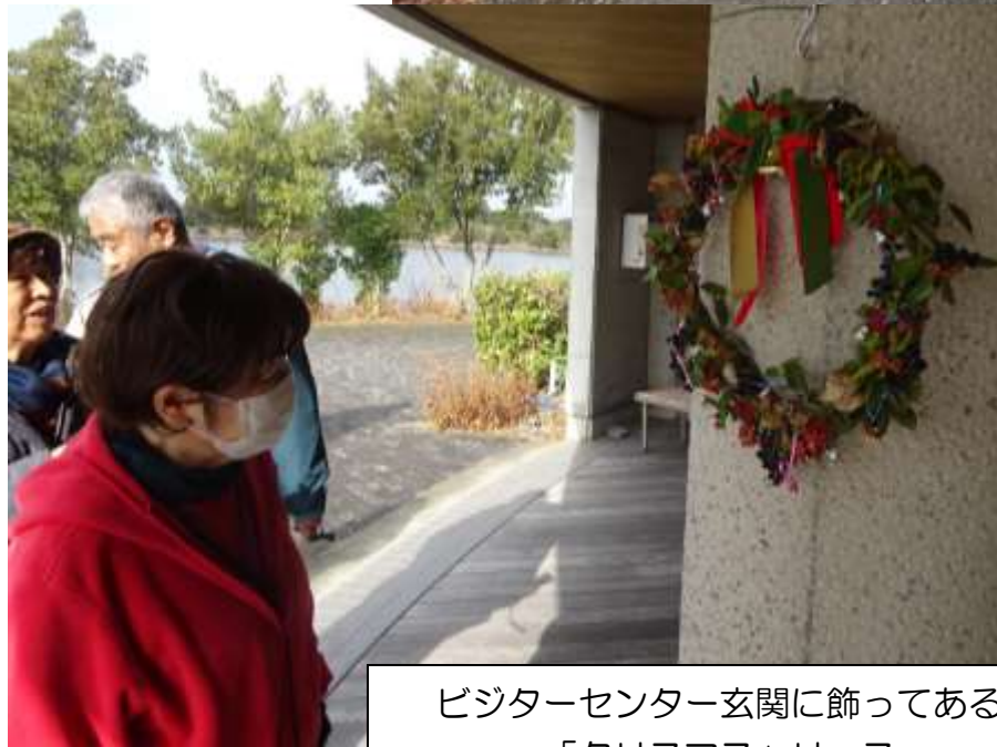
ビジターセンター玄関に飾ってある 「クリスマス」リース