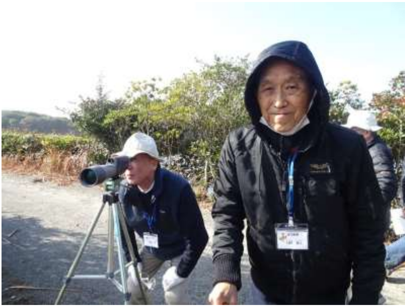
「鷹」「鴨」などいろいろ