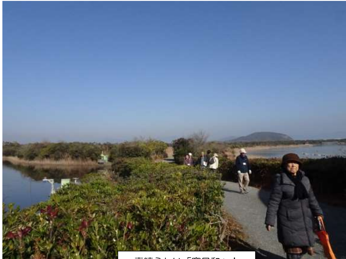
素晴らしい「寒日和」！