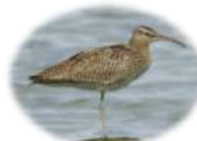
チュウシャクシギ

どちらも夏鳥で園内で子育てします。オオヨシキリは求愛&なわばり宣言に一生懸命な時期でとても見やすいので、口の中が赤いのをチェックするチャンス。