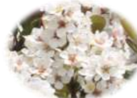
シャリンバイの花

どちらも派手さはないですが絶滅危惧種！ベッコウトンボは午前中のヨシ原周辺がオススメ。人工飼育もしているの運が良ければ羽化が見られるかも？