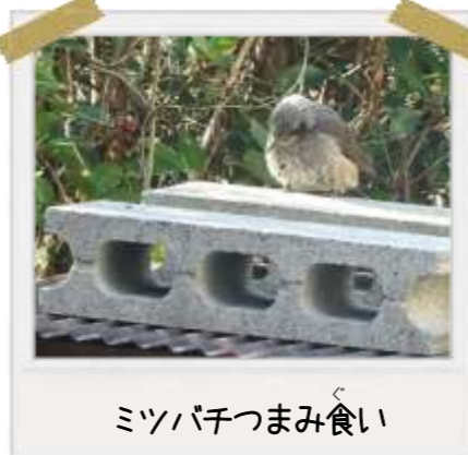
ミツバチつまみ食い