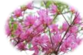
コバノミツバツツジ

いっけんちい じみ なかま 一見小さくて地味なシジミチョウの仲間。しかしこれ うらがわ すがた はね ひら じつ うつく いったい は裏側の姿で、羽を開くと実は美しい！一体どのよ うな色なのか…その目で確かめてみてください。