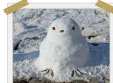
昨日には消えてしまいました