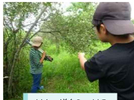
けもの道を見つける