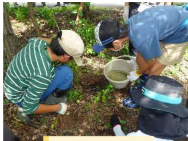
進化した捕獲技術