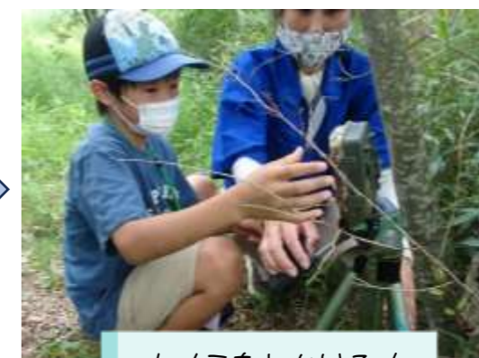
カメラをしかける！