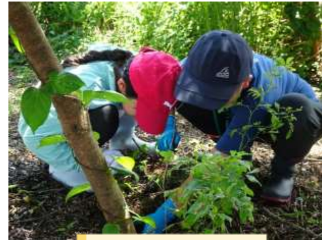
協力が基本らしい