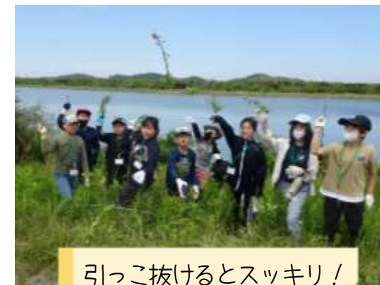
引っこ抜けるとスッキリ！