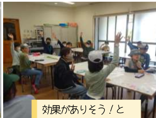
効果がありそう！と 思う案を選びます