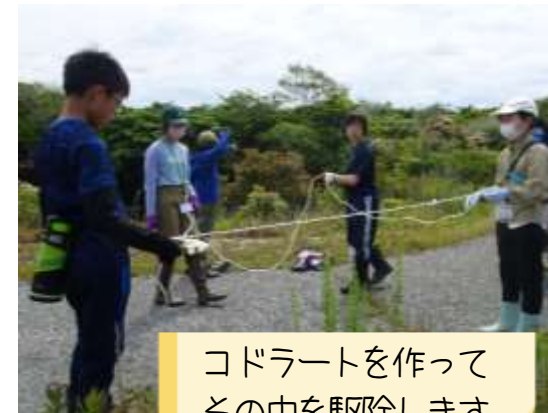
コドラートを作って その中を駆除します