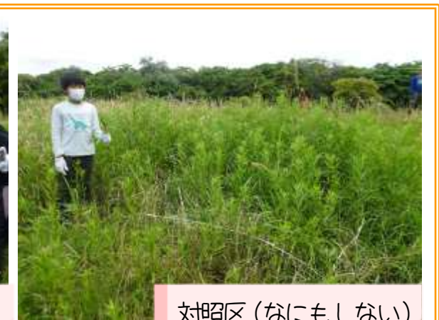
対照区(なにもしない)

対照区と比べることで効果的な駆除方法だったのかを検証します。 結果は11月に確認！はたしてどうなっているのか… おたのしみに～♪