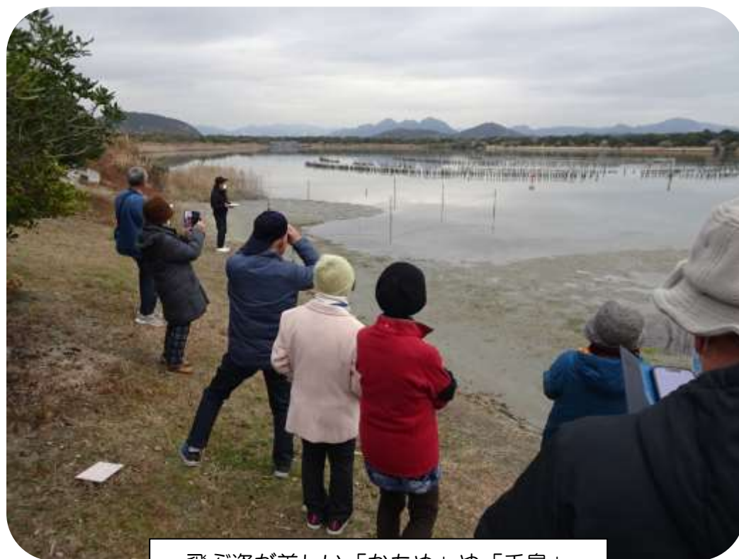
飛ぶ姿が美しい「かもめ」や「千鳥」