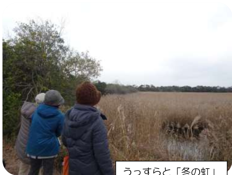
うっすらと「冬の虹」

この日は一年で最も夜が長い「冬至」。 つまりこれから「昼＝陽」がやってくる「一陽来福」の大事な日です。 なぜカボチャを食べるのか？柚子風呂に入るのか？ その背景を学んでから「冬至」の日を詠みました。