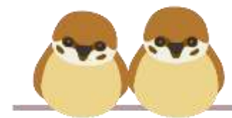
冷えた体に 暖かいお茶が染み渡る…