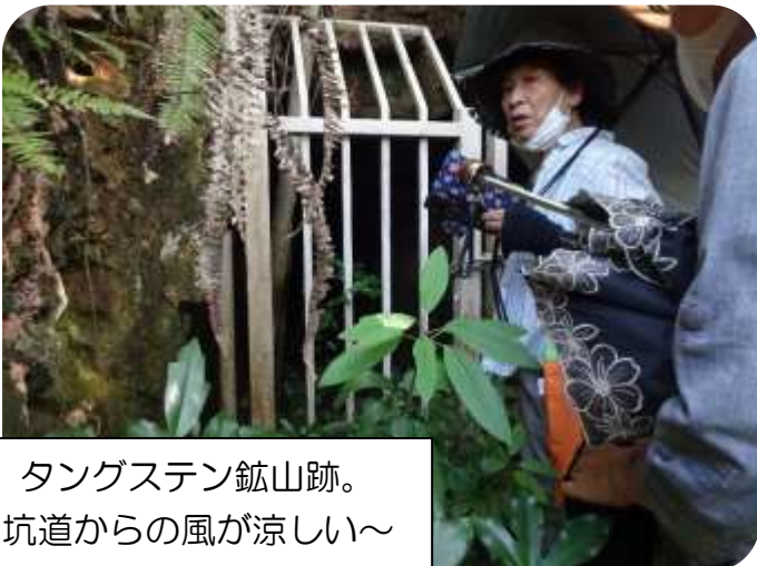
タングステン鉱山跡。 坑道からの風が涼しい～

今回は俳句教室初の園外吟行で、公園のお向かい藤尾山に行きました。 いつもと違う環境で、俳句上達のために「歩く！動く！見る！」を実践!!