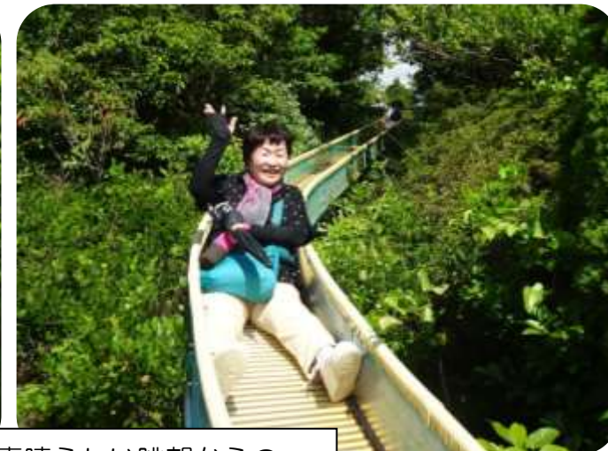
きらら浜が見える素晴らしい眺望からの… ローラー滑り台で一気に下山!