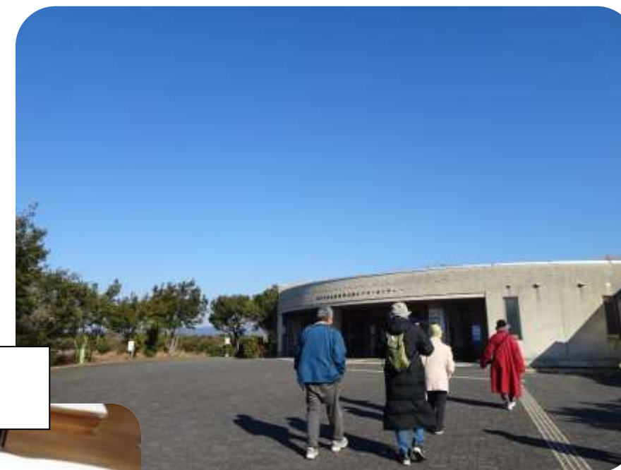
素晴らしい「寒晴」と 美味しいお茶♡