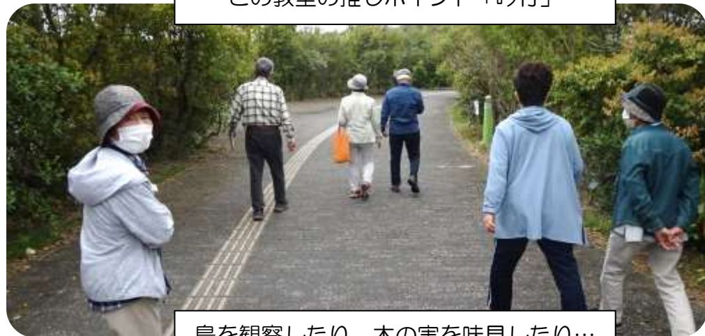
鳥を観察したり、木の実を味見したり… 和気あいあい♪