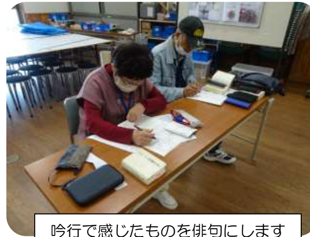
吟行で感じたものを俳句にします