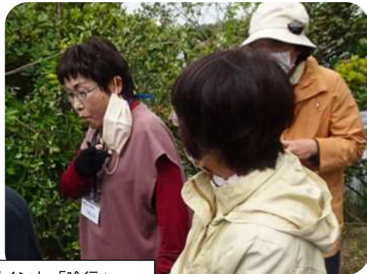
この教室の推しポイント「吟行」