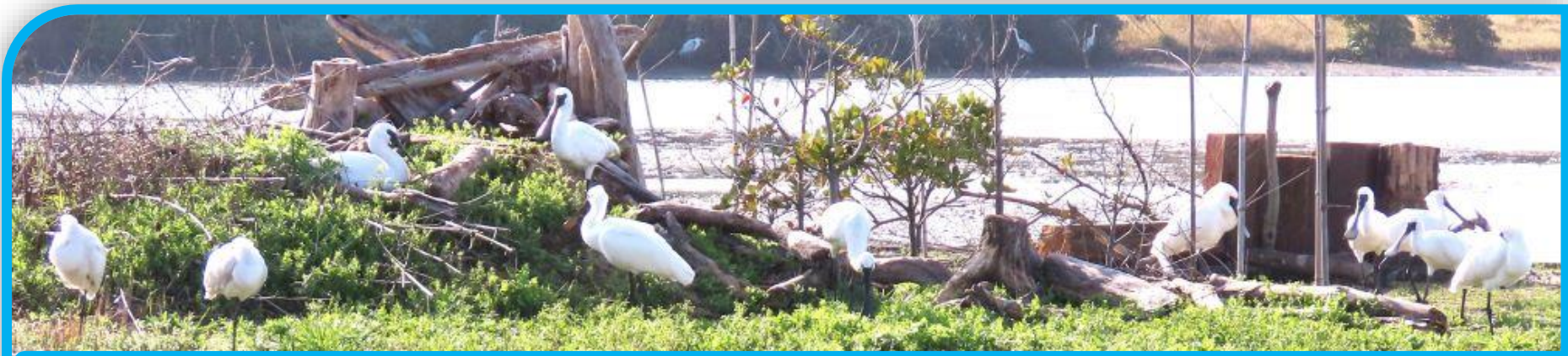
中央園路の奥にある観察舎からは、人工島に集まる9羽のクロツラヘラサギを観察しました。人形に注意！

初回は24種でした。1年後が楽しみ。 今年度は毎回観察できた鳥種の確認を しっかりおこなう予定です。