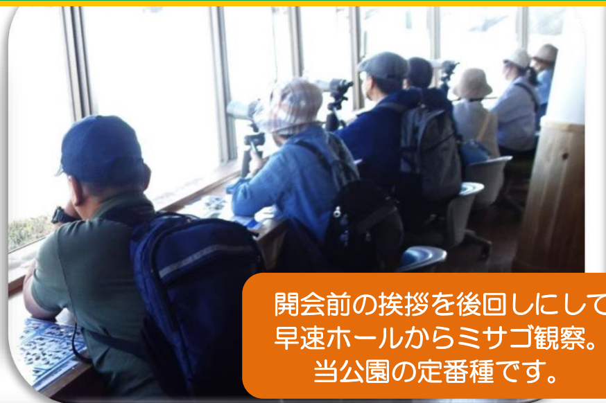
開会前の挨拶を後回しにして 早速ホールからミサゴ観察。 当公園の定番種です。