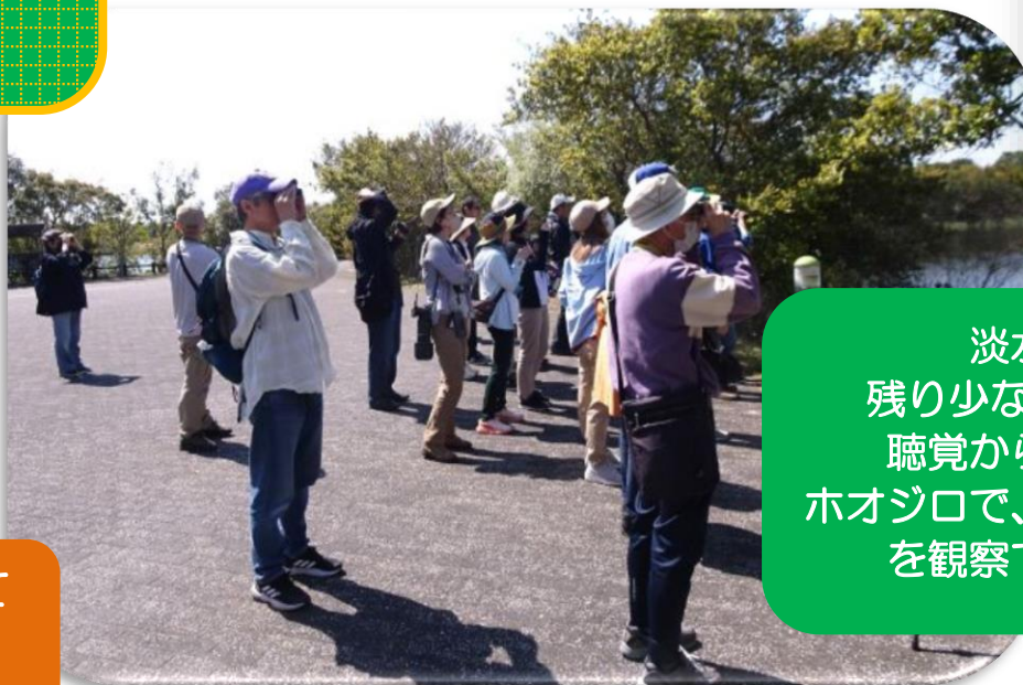
淡水池では 残り少ない水鳥観察。 聴覚から探せたのは ホオジロで、さえずりの様子 を観察できました。