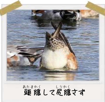
あたまかく しりかく 頭隠して尻隠さず