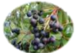
シャリンバイの実