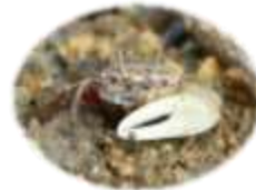
ハクセンシオマネキ