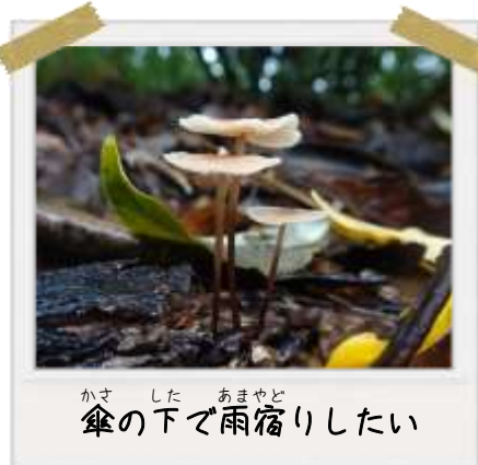
傘の下で雨宿りしたい