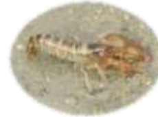
イソテッポウエビ