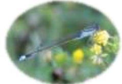
アオモンイトトンボ