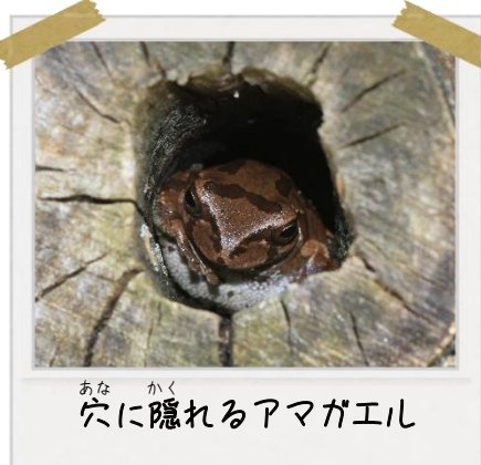
穴に隠れるアマガエル