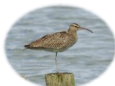
チュウシャクシギ