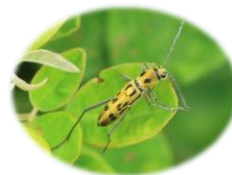
キイロトラカミキリ