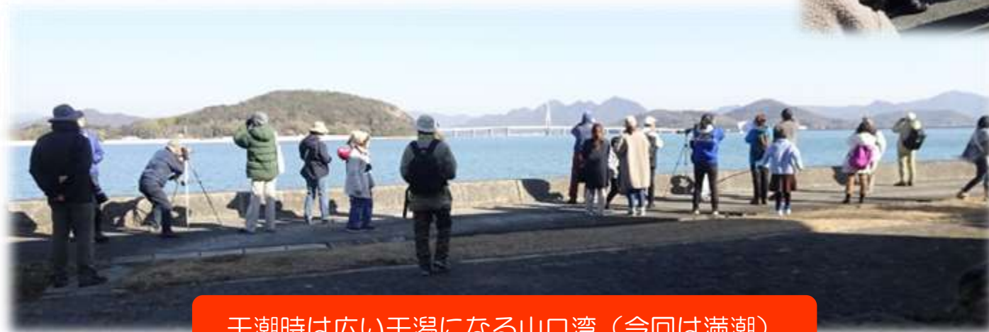
干潮時は広い干潟になる山口湾 (今回は満潮)

今回観察した絶滅危惧種は6種！ 絶滅危惧種が生息するのは失われやすい環境です。 鳥も人間も仲良く暮らす道を考えていきたいですね。