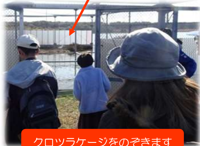
クロツラケージをのぞきます