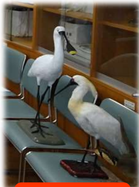
今年も登場 魔改造ヘラサギ