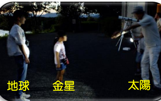
地球 金星 太陽