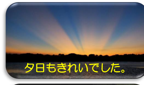
夕日もきれいでした。