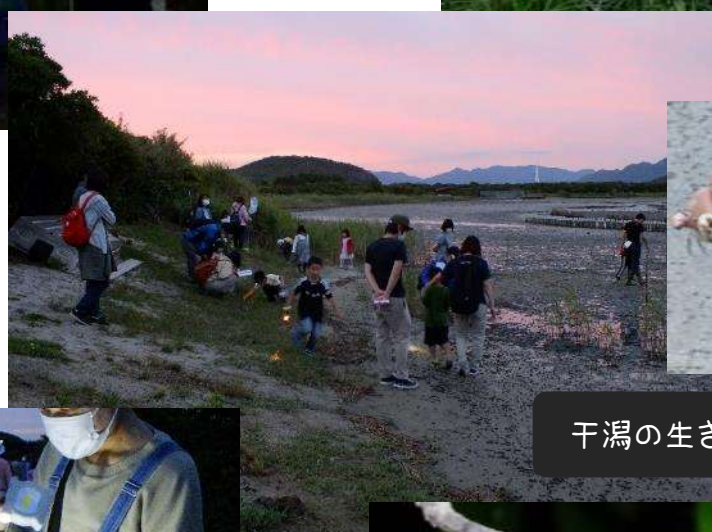
干潟の生き物は昼夜関係なし