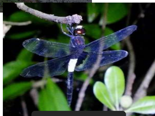
トンボは寝ている