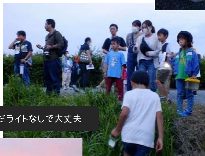
まだライトなしで大丈夫