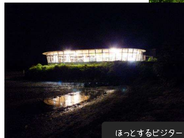
ほっとするビジターセンターの明かり