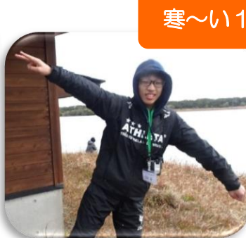
寒〜い1日でしたが、みんな笑顔で楽しみました。