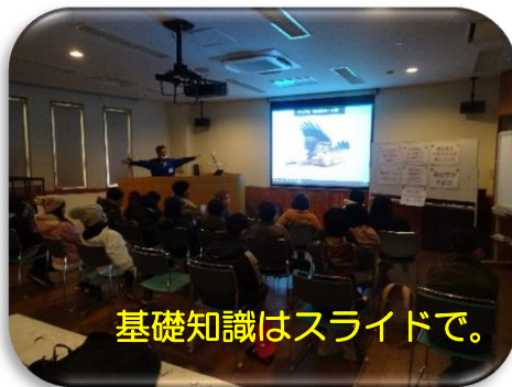
基礎知識はスライドで。