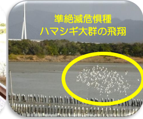
準絶滅危惧種 ハマシギ大群の飛翔