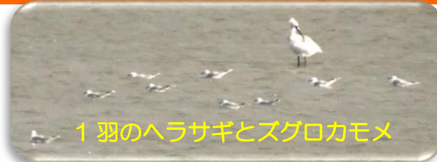
1羽のヘラサギとズグロカモメ

開会前に絶滅危惧Ⅱ類のズグロカモメと情報不足の希少種ヘラサギが居たので館内観察でスタートとなりました。