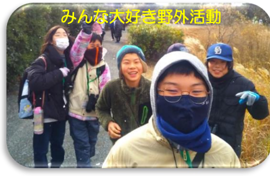
みんな大好き野外活動