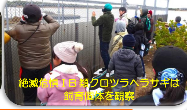
絶滅危惧ⅠB類クロツラヘラサギは飼育個体を観察