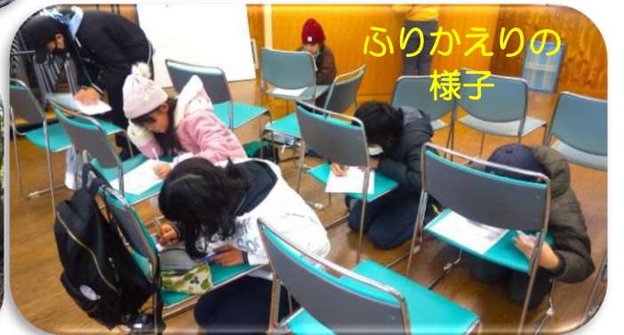
ふりかえりの様子

メンバー全員が観察できたのは4種と少なかったですが、絶滅危惧種観察を通して「自然保護」というキーワードを意識したようでした。