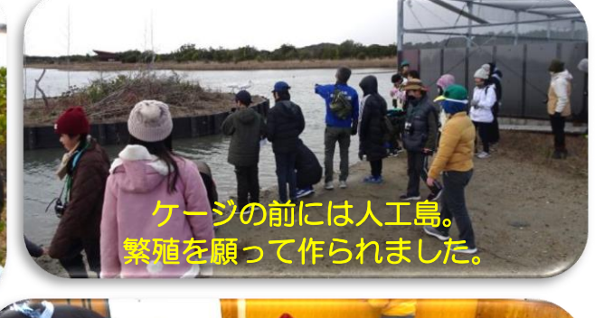
ケージの前には人工島。繁殖を願って作られました。