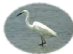
ダイサギ (ごんいんしよく 婚姻色)