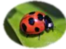
ナナホシテントウ