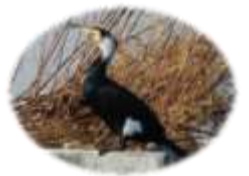
カワウ (はんしよくぼね 繁殖羽)