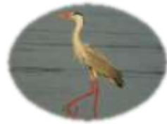
アオサギ (ごんいんしよく 婚姻色)