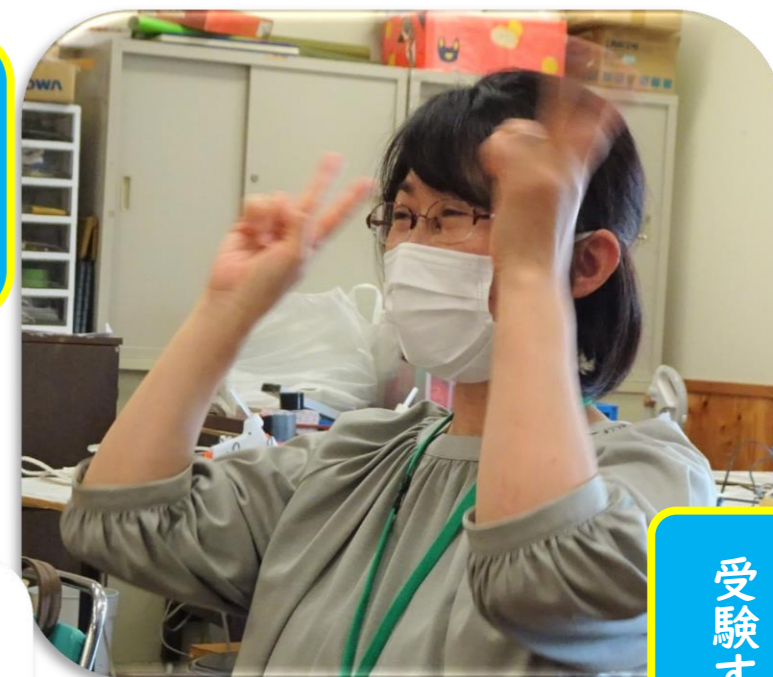
イラスト 手話しゅわ SHUSHUSHU (blog.jp)