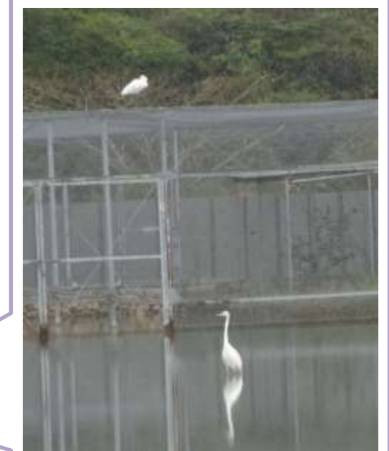
上：クロツラヘラサギ 下：ダイサギ