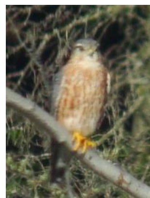
コチョウゲンボウ

今回のテーマは大人気のタカの仲間、猛禽類です。 なぜきらら浜にはこんなにたくさんの種類のタカがいるのか？ いざ、タカ探しに出発!!