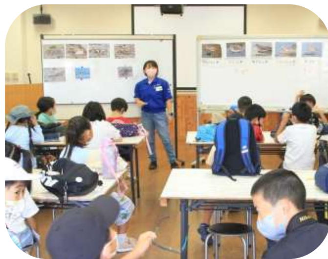
7月の活動で見た生き物

干潟観察舎から、シギ・チドリを探しましたが見つからず…。代わりに ビジターセンターに戻り、シギ・チドリの捕食動画を見てもらいました。