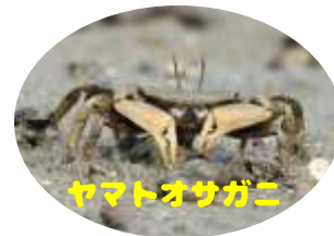
9月の活動で見られる生き物