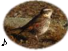
干潟で探餌するツグミ