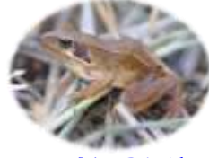
ニホンアカガエル と そのたまご