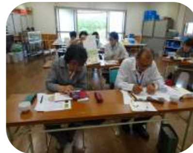
吟行で題材を 探した後は 作句！