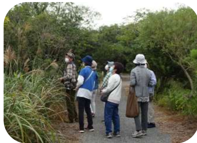
空を見上げると、燕たちの群れが飛び回り、足元に目をやると、萩の花が咲いていました。