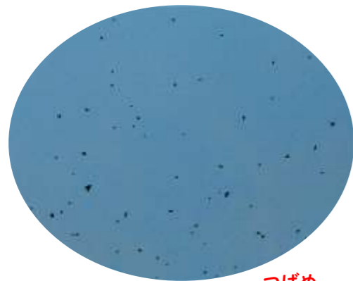
群れて飛び回る燕 つばめ