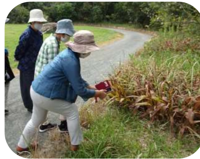
かえる 茶色い蛙 (ニホンアカガエル)