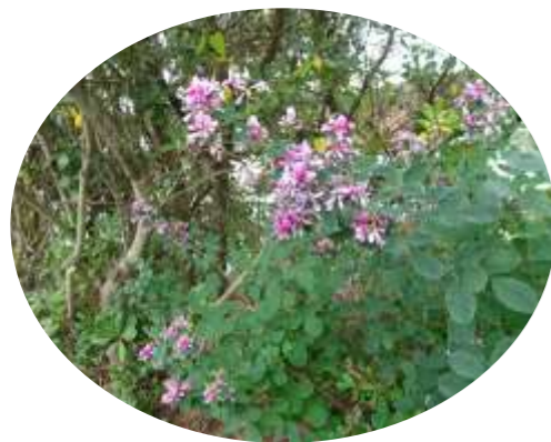
沢山咲いている萩の花