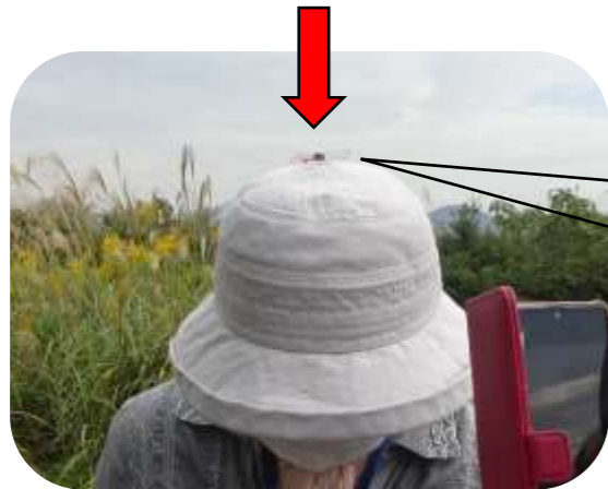
あ！帽子の上に赤蜻蛉！ あかとんぼ

新型コロナウイルス感染予防対策の一環で前回は中止となりましたので、1ヶ月ぶりの開催となりました。その間、園内はすっかり秋模様になりました。今日はどんな句が生まれるのでしょうか？