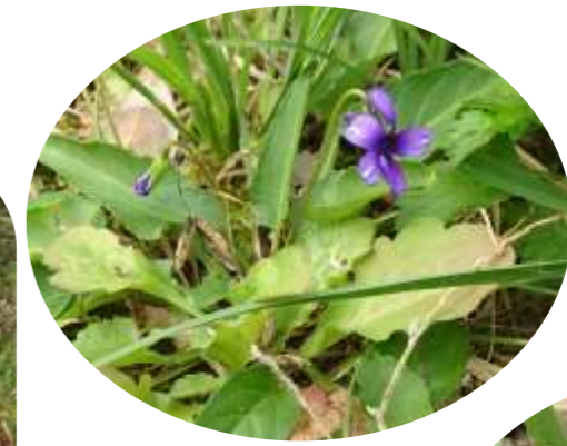
一輪だけ 咲いていた すみれ 堇の花