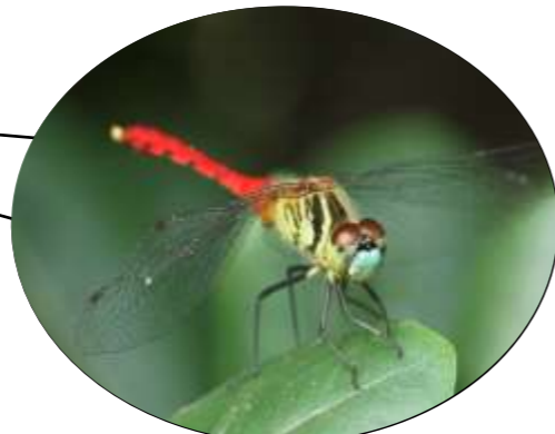
あかとんぼ 赤蜻蛉 (マイコアカネ)