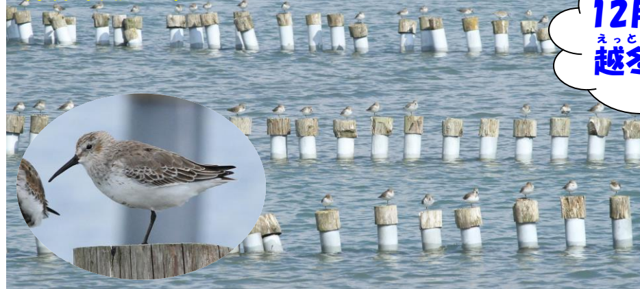
満潮時、杭で休むハマシギ