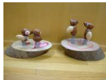
工作「ラブラブバード」