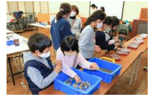
材料は部屋の前後に分けて配置して、密にならないように配慮してあります。