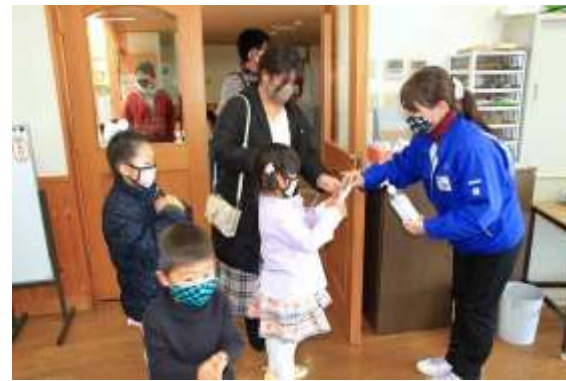
入室時には手の消毒をしてもらい、同時に門松の材料セットを配布します。