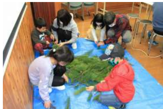
部屋の一角には松の葉を用意しました。自分で必要な分だけ持って行ってもらいます。