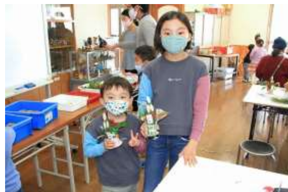
作成できるのは一家族一対です。きょうだいで、親子で仲良く一個ずつ作っていました。筒に巻く紙の種類がたくさんあるので、みんなの個性が出ているいろいろな門松ができあがっていました。