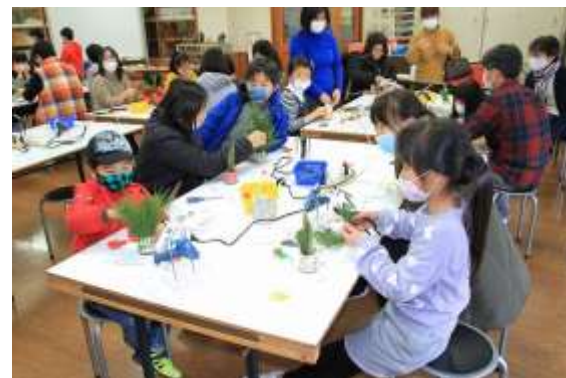
作業が進んで完成が近づいてきました。扇などの飾りを付けると華やかになります。