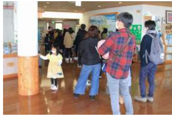
開始前に入室の際の注意事項を説明しました。行列ができます。