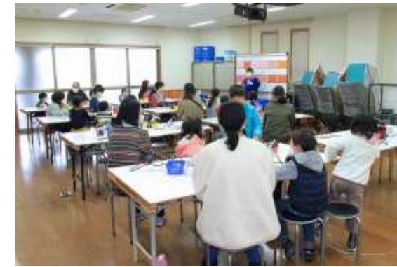
作業台は普段の倍の四列用意して臨みました。始めに作り方の説明をします。