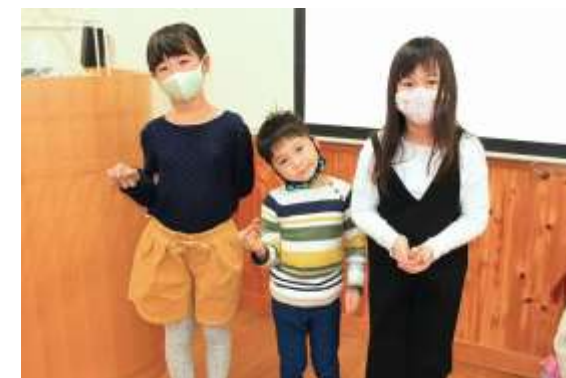
作業は単純ですが、頭に使うどんぐりの大きさや形、胴体に巻く紙や色塗りなどで、それぞれできあがりにかかなりの違いが出ます。丑は今年の干支なので、大事に飾ってくださいね。

今年は新型コロナウイルス感染予防で定員を30名に限定したため、例年のような賑やかさはありませんでしたが、素敵な作品がたくさんできあがっていました。参加して下さったみなさん、ありがとうございました。みなさんに幸せが訪れますように。