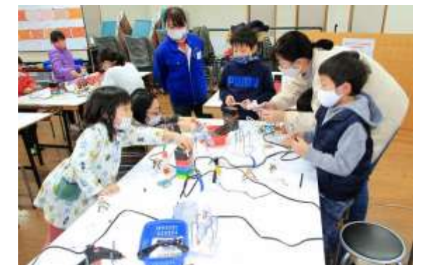
このメニューは作業が単純で、小さな子どもでも簡単に作ることができます。